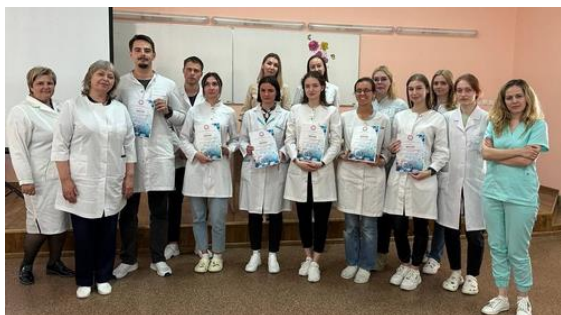
С участниками и победителями олимпиады среди студентов 5 курса лечебного факультета по дисциплине "Детские инфекционные болезни" (декабрь 2023 г.)