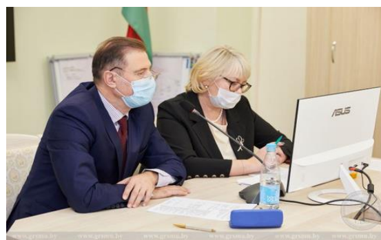
Онлайн-конференция инфекционистов «Актуальные вопросы коронавирусной инфекции» (2021 г.)