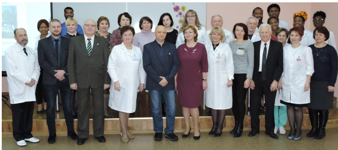
С участниками конференции «Актуальные вопросы социально-значимых инфекционных болезней» (Гродно, 2018 г.)