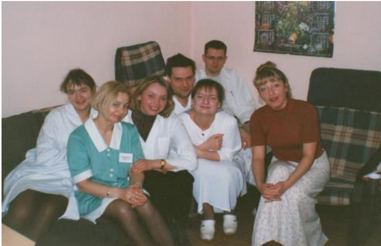
Стажировка в Поморском медицинском университете (РМУ) (г. Щецин, Польша, 2002 г.)