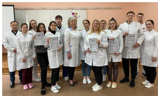
С участниками и победителями олимпиады среди студентов 5 курса педиатрического факультета по дисциплине "Детские инфекционные болезни" (16-17 мая 2023 г.)