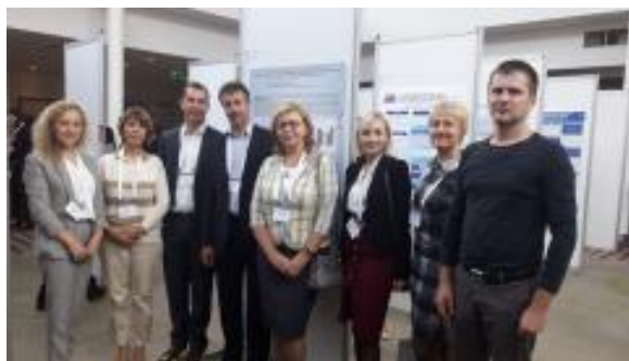
Восточно-европейская конференция по ВИЧ и вирусным гепатитам (Вильнюс, 2019 г.)