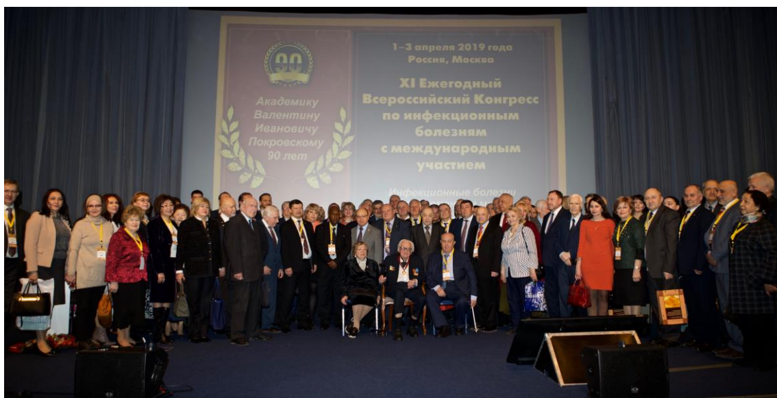
На Всероссийском конгрессе по инфекционным болезням, посвященном 90-летию академика Валентина Ивановича Покровского (Москва, Россия, 1-3 апр. 2019 г.)